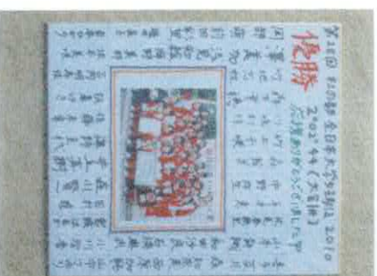
佛教大学 全日本大学優勝 色紙