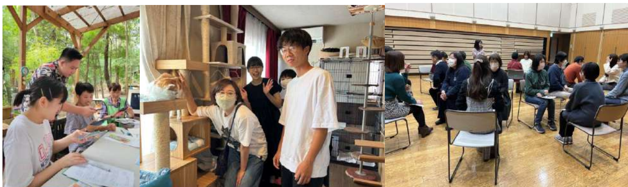
▲昨年度の活動の様子

学生おうえん隊は NPO や市民活動団体と一緒に活動してみたい！という学生と、学生と一緒に活動してみたい！というまちカフェ！参加団体をマッチングする取り組みです。2020 年度にスタートした本プロジェクトは、若い世代の視点を団体活動に取り入れ、新しい事業への挑戦やスキルアップを実現してきました。学生を受け入れた団体からは「フレッシュな考え方や知識に刺激を受け、新しいチャレンジができた」などの声を多数いただいています。